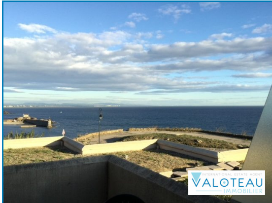
VUE DEPUIS LE SEJOUR ET LA TERRASSE